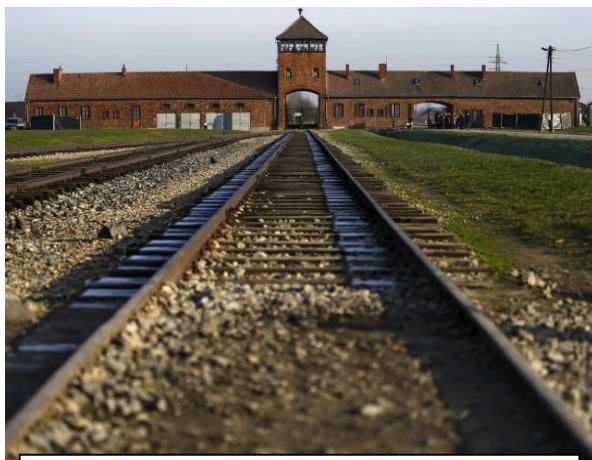
Camps d'Auschwitz 2 en janvier 2015

Nom inscrit au Mémorial de la Shoah (Paris)